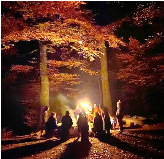
Fackellauf am Jungleiterweekend

Nicht immer läuft alles nach Plan, so auch im Jugendwerk nicht. Auch dieses Jahr begleitete uns die Pandemie das ganze Jahr hindurch. Mit regelmässig angepasstem Schutzkonzept konnten wir jedoch die meisten Anlässe durchführen. Neben den öffentlichen Anlässen durften wir bereits Anfang des Jahres mit neuen engagierten Jungleitern die Schulung starten. Bereits Mitte März haben sieben Jungleiter/innen die Schulung abgeschlossen. Zusammen mit den neuen Teamlern starteten wir im März nach den Lockerungen wieder mit unseren öffentlichen Angeboten.