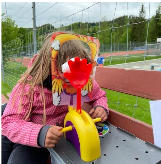
Challenge bei der Schnitzeljagd!

Beim Kinderangebot am Mittwochnachmittag nahmen zwischen 15 und 25 Kinder teil. Ebenfalls haben ca. 12 – 20 Kinder aus der 5. und 6. Klassen, welche üblicherweise das Donnerstags-Programm besuchen am Kinderangebot teilgenommen.