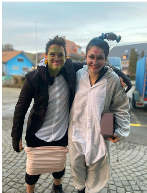
Teamlers und Standortleitung

Denn ohne die Hilfe der freiwilligen Jugendlichen geht es nicht: Obwohl viele Anlässe gestrichen wurden, leisteten die Jugendlichen letztes Jahr 541.8 Stunden ehrenamtliches Engagement! Ein riesiges Kompliment und herzlichen Dank dafür!