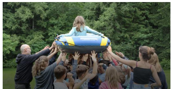
Mega Lager im Sommer!

Auch das « Jungleiterweekend » fand dieses Jahr wieder statt. Die Jugendlichen wurden bei einem Krimi Dinner in Empfang genommen, bei welchem sie ihr Schauspiel wie Detektiv Künste unter Beweis stellen mussten. Bei einer kleinen Wanderung von Hasli-Rüegsau nach Lützelflüh stellten wir ihr Durchhaltevermögen mit verschiedensten Aufgaben auf die Probe. Der Besuch im Bowlingcenter und im Adventure Room in Zürich versprach dann aber auch noch Abenteuer und Spass. Die freiwilligen Jugendlichen wurden nach 24 Stunden zwar kaputt, jedoch mit vielen neuen Erfahrungen, wieder den Eltern übergeben.