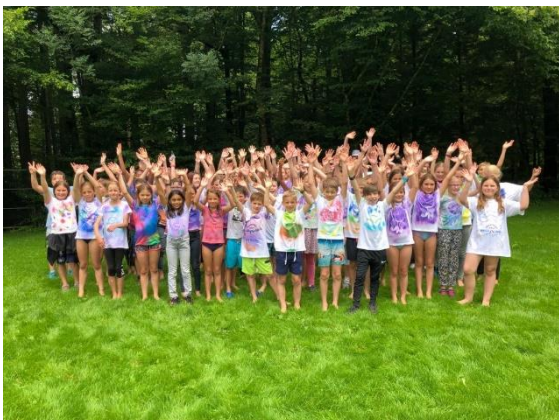
Glückliche Kinderaugen am letzten Sommerlagertag!

Für das neue Jahr sind viele neue Angebote und Projekte geplant. Bereits stehende Projekte sollen erneuert und angepasst werden, da wir stets nah am Puls der Jugend bleiben wollen.